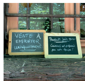
Actualités page 11