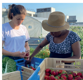
Insertion & formation page 9