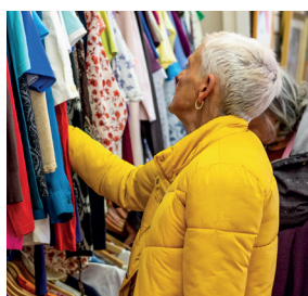
Agriculture urbaine & économie circulaire page 6