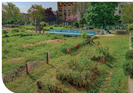
Jardin Henri Barbusse