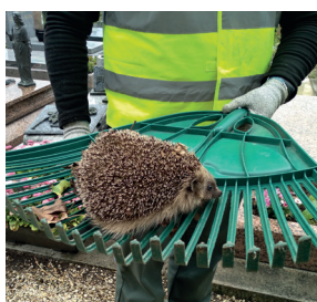
Du sur-mesure à Saint-Cloud page 2

L'équipe de production maraîchère d'Espaces va à la rencontre des habitant-es d'Aubervilliers