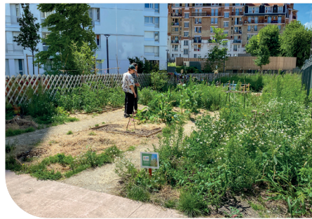
Jardin Cité Blanche