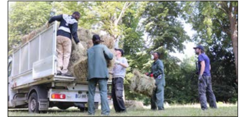
▼ Les foins au Domaine, le 26 juin 2019