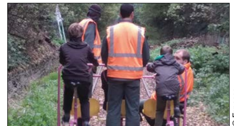
▼ Balade en vélorail sur la Petite ceinture