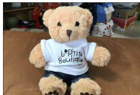
▼ Noé, la mascotte de La P'tite Boutique

► La vente a lieu mercredi et samedi de 10h30 à 13h30 et de 14h30 à 18h30 ; le dépôt des dons se fait pendant les