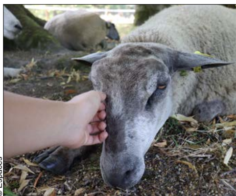
▼ Si la ferme pédagogique séduit les enfants...