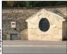
▼ Fontaine du Roy, à Ville-d'Avray

filiale de Veolia, pour étudier l'utilisation des ressources en eau non potable disponibles (pluie, source, exhaure). Le 5 juillet 2019, l'association a présenté un retour d'expérience