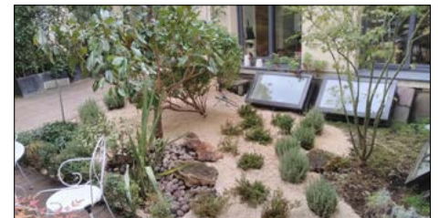
▼ Patio de la CPME, Paris 16°

L'équipe du chantier PETITE CEINTURE ET ESPACES VERTS 14-15 a restauré un patio pour la Confédération des petites et moyennes entreprises (CPME) dans le 16° arr. : sélection végétale, taille des arbustes, désherbage, réalisation de massifs colorés, épandage