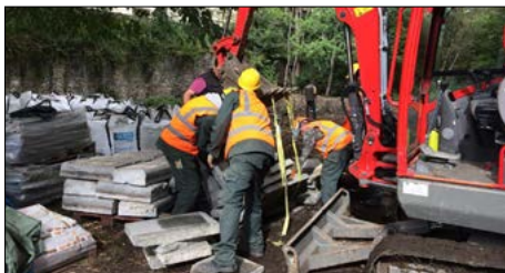
▼ Aménagement du jardin partagé (sentier nature)

L'équipe du chantier ESPACES VERTS ET NATURELS PETITE CEINTURE 16-17 a participé à la création du jardin partagé du Sentier nature, en partenariat avec Oïkos et Horizon nature et avec le soutien de la Mairie du 16°, de la Région Ile-de-France et de la Ville de Paris. Au programme : réalisation des tranchées, installation des piquets d'acier formant les bases pour les tressages d'osier, bétonnage, mise à niveau du sol, remplissage des jardinières.