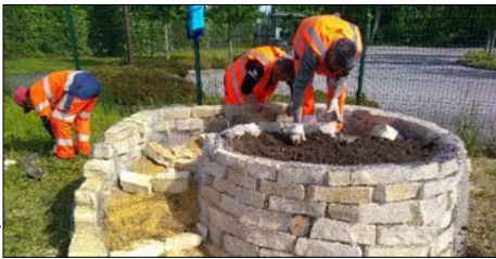
▼ Spirale à insectes à Garancières