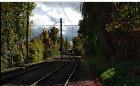
▼ 16 km de voies ferrées à entretenir

En 2016, Espaces a mis en place un partenariat avec la RATP. Le T2 fut tout désigné, pour la variété de ses sites en rapport à son histoire, soit 16 km de voies ferrées. Une particularité : la nécessité de former les salariés au déplacement à pied sur les voies, à la protection et la mise en place du dispositif de sécurité. Autre aspect technique : le droit à une carte d'autorisation, délivrée par la RATP, pour circuler sur les voies et se trouver dans les emprises RATP.