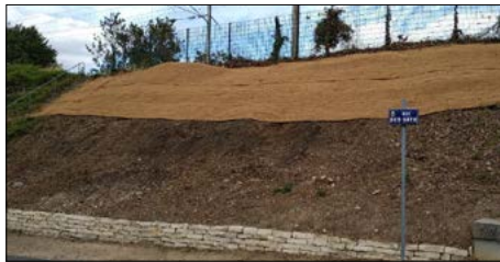
▼ Talus végétalisé à Rosny-sur-Seine