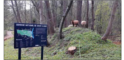
▼ Ecopâturage dans le parc de Saint-Cloud

Le chantier d'insertion du Domaine national de Saint-Cloud participe à l'entretien des 450 hectares du site.