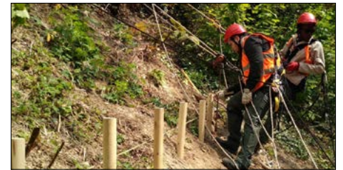
▼ Travaux encordés sur la Petite ceinture (15°)